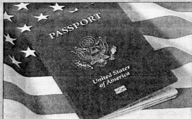
■ От началото на настоящото десетилетие досега броят на върналите американския си паспорт надминава 8000

От началото на настоящото десетилетие досега броят на отказалите се от американско гражданство надминава 8000. Само